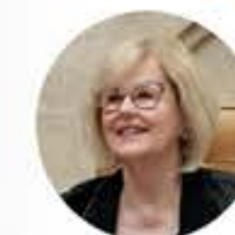
Ministra Rosa Weber Vice-Presidente do STF

O trabalho cruel, degradante e forçado marcou a formação inicial do Estado brasileiro. Nossa primeira Constituição, de 1824, foi escrita ainda durante o período do Império, quando estava em vigor a escravidão e não havia qualquer possibilidade de associação dos trabalhadores.